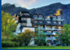
Bad Reichenhall Seite 4