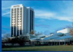
Leonberg/ Stuttgart Seite 8