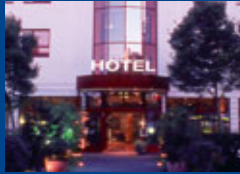
München Seite 9