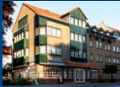
Ahrensburg/ Hamburg Seite 3

Wünschen Sie weitere Leistungen, einen Begrüßungsumtrunk bei Tagungsbeginn? Gerne stellen wir Ihnen Alternativen vor.