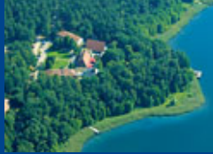
Templin/ Groß Dölln Seite 10