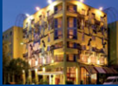
Berlin Seite 5