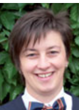
Tagungsservice Rabea Elbrs

Fon +49 3722 513-333 Fax +49 3722 513-100 elbrs@amber-hotels.de