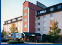
Chemnitz Seite 6