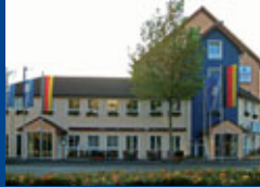
Hilden/ Düsseldorf Seite 7